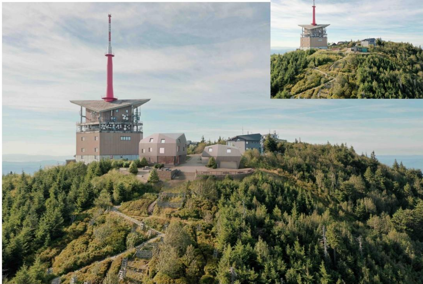
A: Atelier KIELAR s.r.o. I: AK 1324 s.r.o.