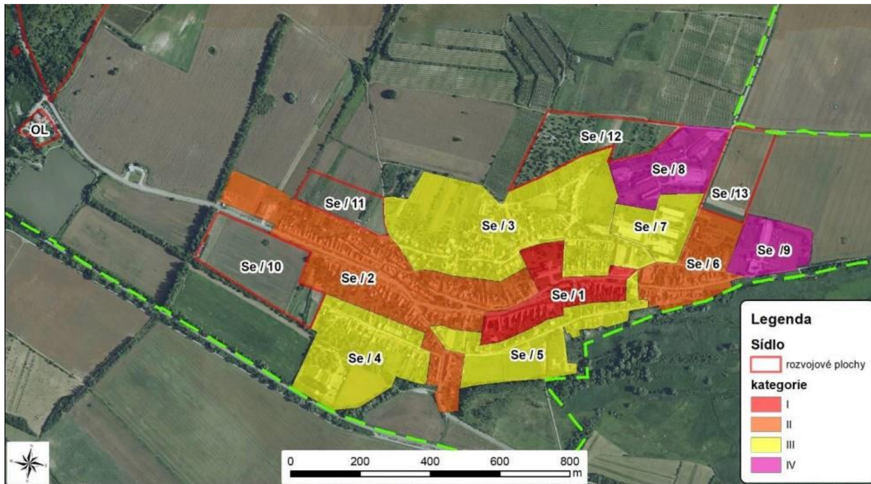
Sedlec u Mikulova – PHKR CHKO Pálava