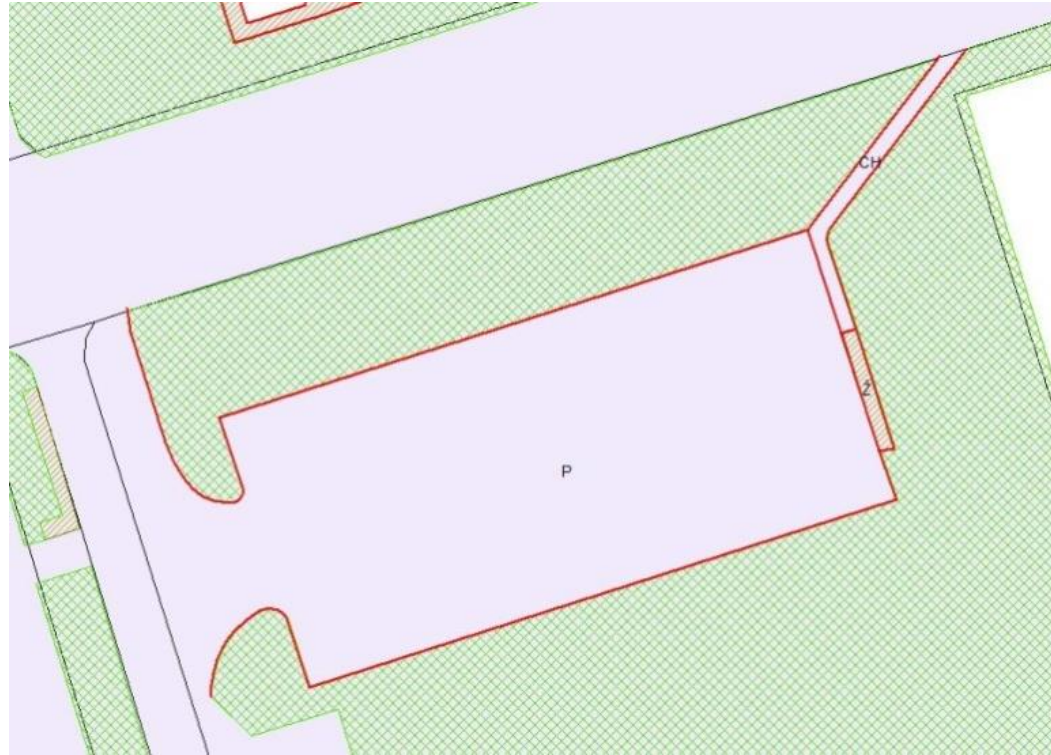
Plocha verejnej zelene zabratá investičnou výstavbou (zpracovanie geodetického zamerania)

Aktivita je realizovaná v rámci národného projektu Zlepšovanie informovanosti a poskytovanie poradenstva v oblasti zlepšovania kvality životného prostredia na Slovensku . Projekt je spolufinancovaný z Kohézneho fondu EÚ v rámci Operačného programu Kvalita životného prostredia.