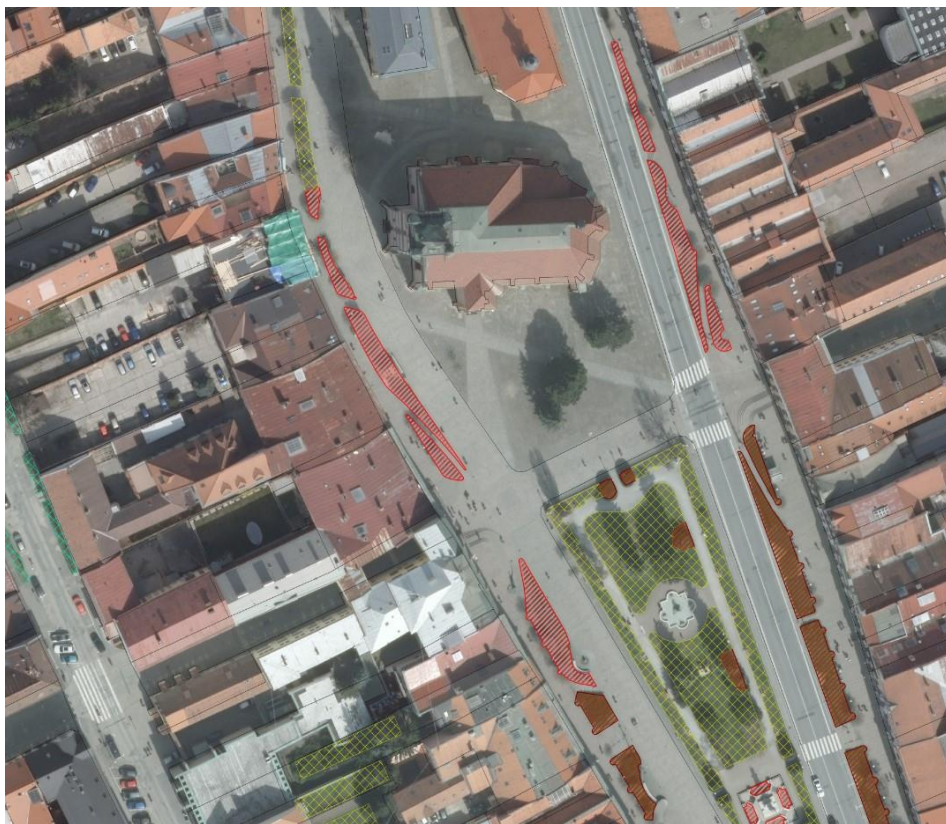
Pasport verejnej zelene mesta Prešov

Výsledný pasport verejnej zelene je prezentovaný vo výmennom formáte „shapefile“, ktorý je kompatibilný so všetkými bežne používanými GIS riešeniami.