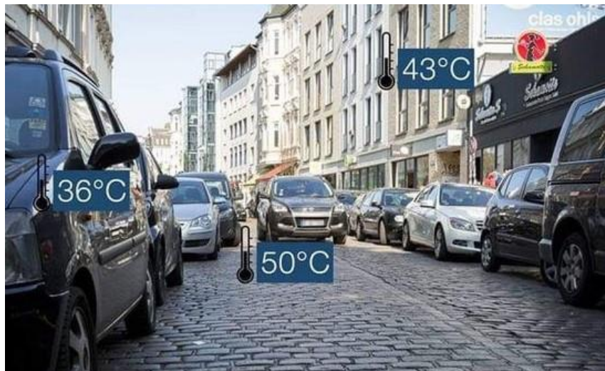
MESTSKÝ PRIESTOR BEZ VZRASSTLEJ ZELENE